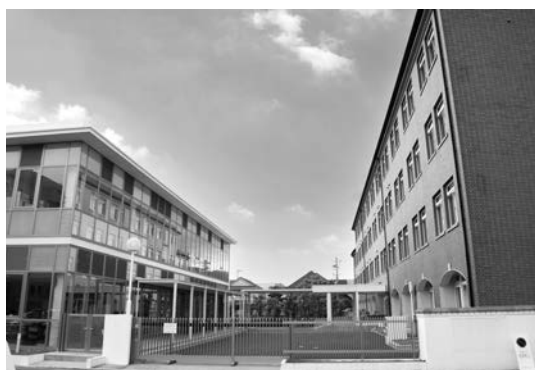
西宮北口キャンパス 阪急電車「西宮北口駅」から5分