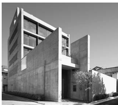
中央キャンパス IR (学術研究交流館) 阪神電車「鳴尾・武庫川女子大前駅」から5分